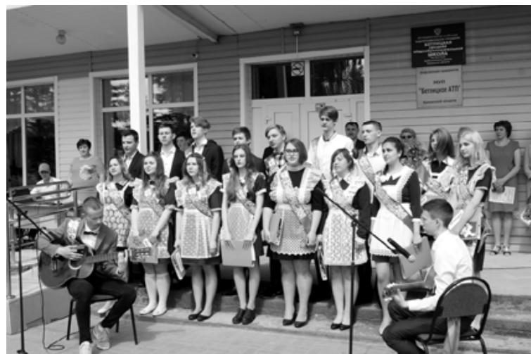
Останется в душе та школьная мелодия, что вместе мы сложили

счастья, удачи, благополучия и достойных успехов во взрослой жизни.