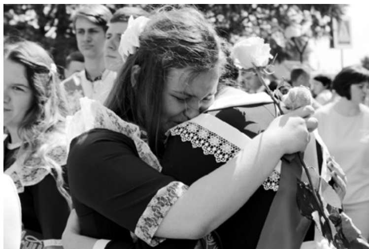
Сегодня со школой прощаясь, о детстве своем все грустим

грамоты отличившимся ребятам. Многие из выпускников были удостоены чести получить сразу по несколько грамот и дипломов за успехи в учебной программе и во множестве мероприятий и конкурсов, проходящих как в стенах родной школы, так и в наших районе и области.