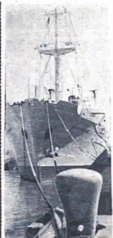
Крупнейшее советское научно-исследовательское судно «Михаил Ломоносов» в Гаванском порту. На борту корабля, оснащенного новейшей аппаратурой для проведения океанографических исследований, находится большая коллекция наших ученых. Советские и кубинские океанологи выполняют широкую программу исследований в бассейнах Карибского моря и Мексиканского залива. На снимке: советское океанографическое судно «Михаил Ломоносов» в Гаванском порту.

— Как вам сказать? — Володя подошел к умывальнику, взял мыло, но, держа его в руках задумался. — Обретаются в России, но изъять из среды ее свободных граждан.