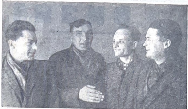
Много грузов приходится перевозить совхозу «Россия». С честью справляются с этой нелегкой работой шофера совхоза. В любую погоду машины, наполненные грузом, идут по дорогам.