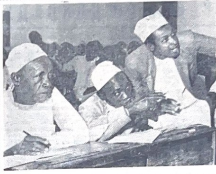
Народы Республики Танзани, в которой объединились две африканские страны Танганьика и Занзибар, по-новому строят жизнь. Начаты преобразования в области здравоохранения и просвещения. Ведется борьба с неграмотностью. Открыты школы для взрослых. Старики впервые садятся за парты.

На снимке: урок в школе для взрослых. Обучение ведется на языке суахили.