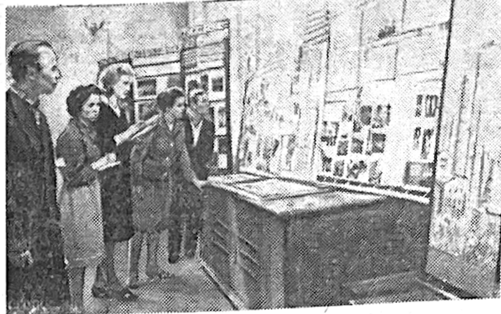
В Тульском Доме политического просвещения открылась выставка, которая завершает проходящий в области смотр-конкурс наглядной агитации. Здесь представлены красочные плакаты и плакаты, многочисленные фотографии, номера стеновых газет, альбомы, отражающие жизнь трудящихся области, их труд и быт. На снимке: работники библиотек и клубов в одном из залов выставки.