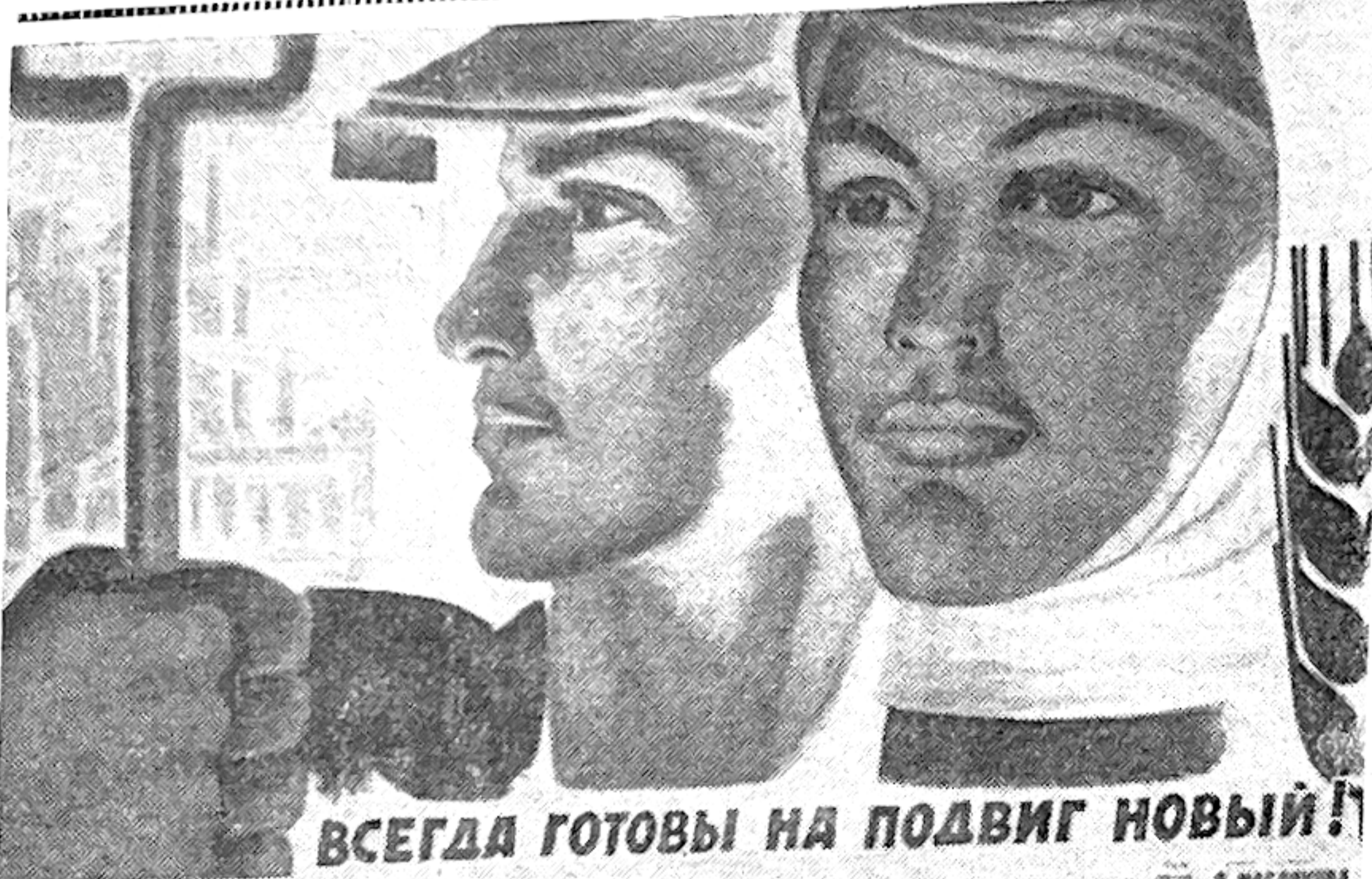
ВСЕГДА ГОТОВЫ НА ПОДВИГ НОВЫЙ!