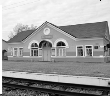
Железнодорожная станция БЕТЛИЦА