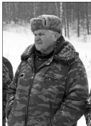
Уйму положительных эмоций получили все участники. И

В перерыве между подведением итогов и награждением весело и с огоньком прошли состязания по бурению лунок на скорость.