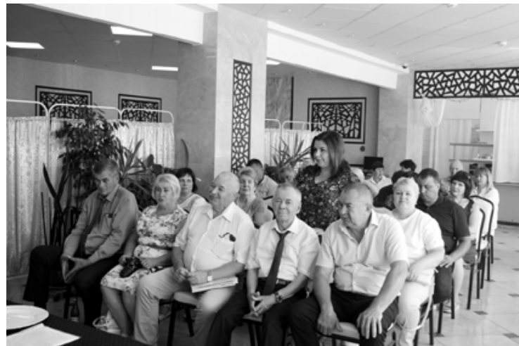
Расширенное заседание Совета облпотребсоюза.

А уже с более подробным докладом с множеством итоговых результатов и материальных и других затрат выступил заместитель министра конкурентной политики Калужской