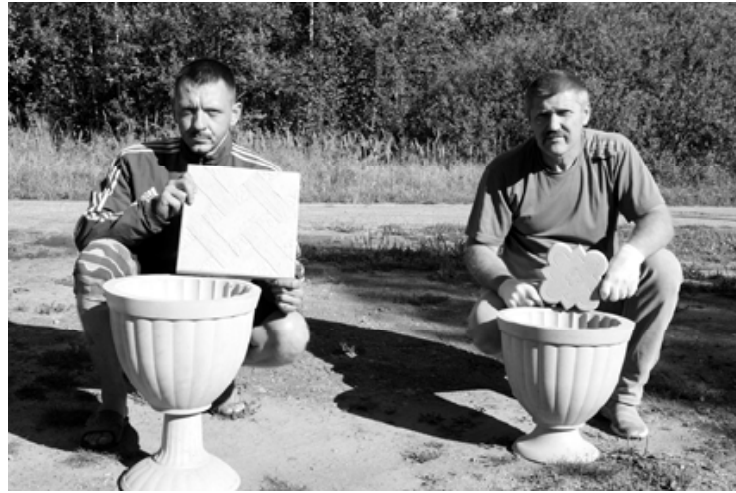
С готовыми изделиями

меров и форм, а также самые различные декоративные вазоны - для эстетического оформления усадебных территорий и благоустройства мест захоронений на кладбищах.