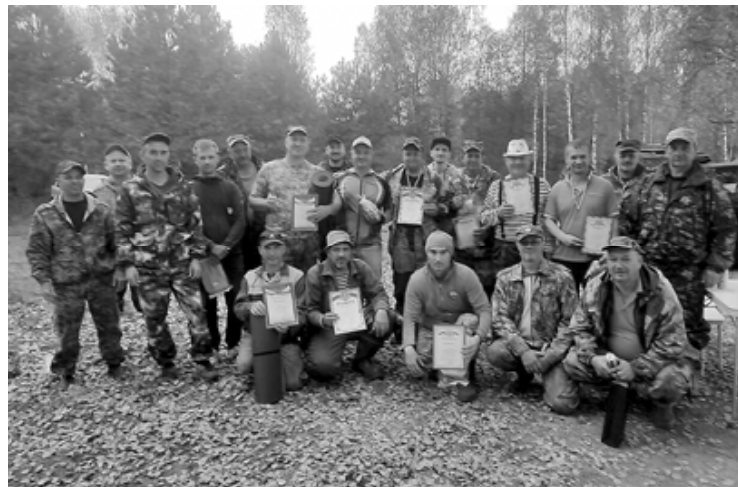
Участники фестиваля по рыбной ловле