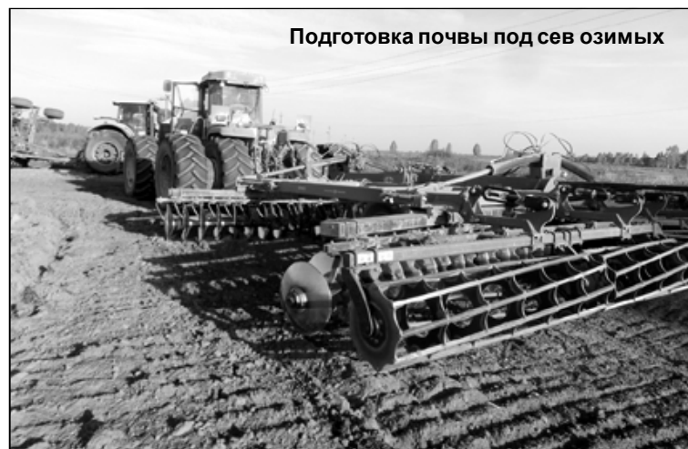
Подготовка почвы под сев озимых