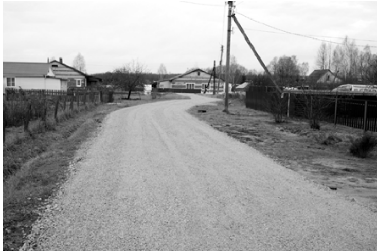
Дорога переулка Школьный

выдержан приличные нагрузки. На восстановление этого участка было потрачено 650 тысяч рублей из регионального и местного бюджетов. Эти средства удалось сэкономить при проведении торгов по ка-