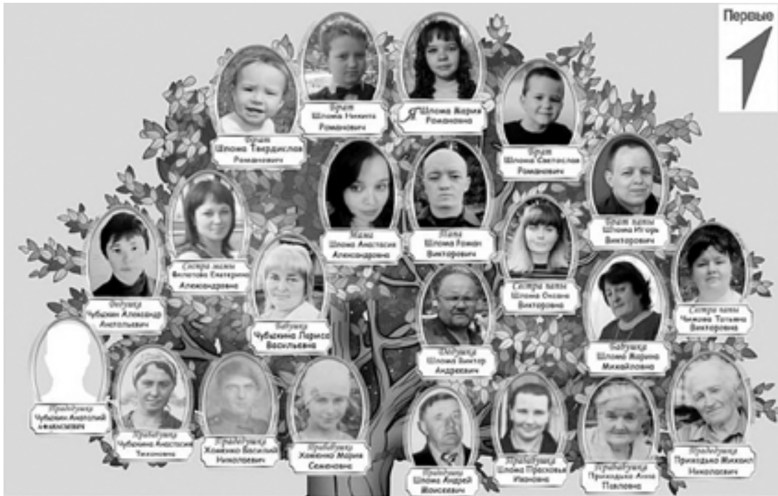
Генеалогическое древо семьи Шлома