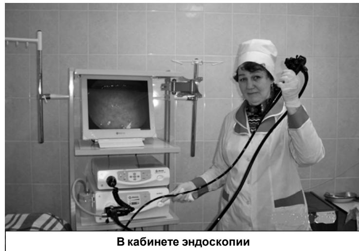
В кабинете эндоскопии

Медицинская сестра - это специальность, значимость которой трудно переоценить. По существу, ни один врач не сможет справиться со своими обязанностями, если у него не будет такого помощника. Она - это прежде всего правая рука врача. Ее главной задачей является выполнение указаний доктора, за которым она закреплена, и отличительной особен-