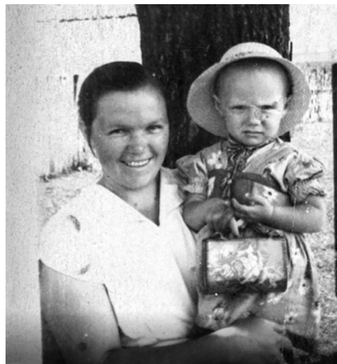
В детстве с мамой

Лариса ЛУЧКИНА