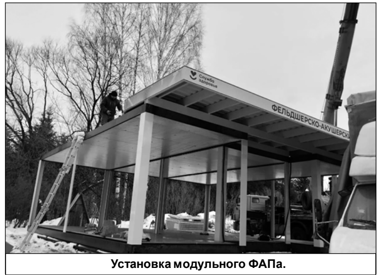
Установка модульного ФАПа.

Во второй половине декабря строители начали собирать модульный корпус будущего фельдшерско-акушерского пункта, и это вызвало положительные эмоции у жителей деревни в преддверии