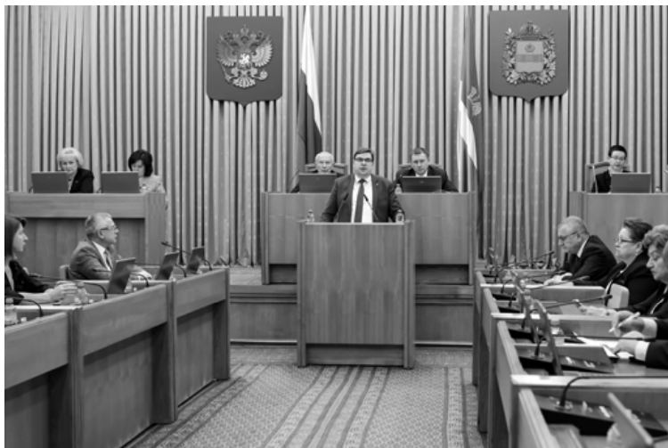
Две новые выплаты помогут улучшить демографическую ситуацию