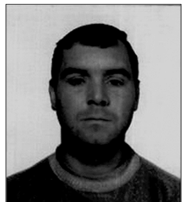
мер обуви 41.

Приметы: на вид 40 лет; среднего телосложения; рост 170-175 см; плечи горизонтальные; лицо по форме овальное, европейского типа; лоб по высоте средний; брови по форме прямые; глаза зеленые; нос большой, прямой; рот средний; губы средней толщины; подбородок по положению вертикальный; уши большие, прилегающие; волосы прямые (короткие), рыжего цвета; раз-