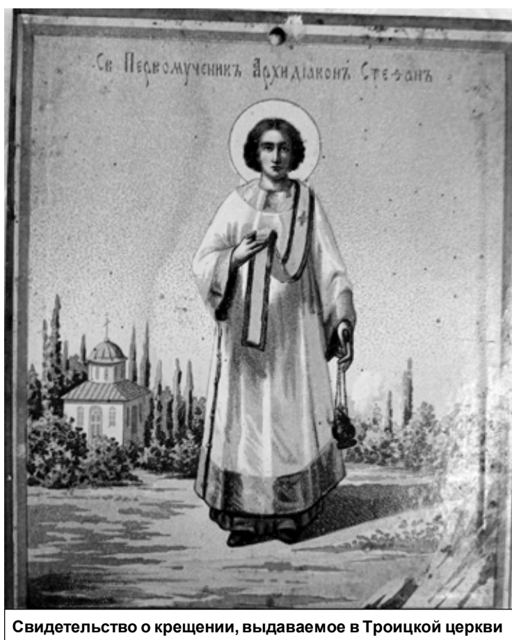
Свидетельство о крещении, выдаваемое в Троицкой церкви