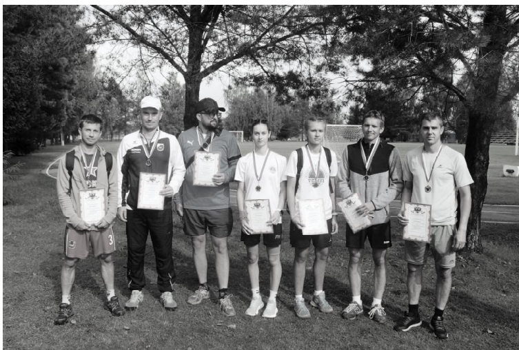
Победители праздничной спартакиады

писем от регионального министерства спорта, районной администрации, спортивного совета и МКУ "Темп", а также меда-