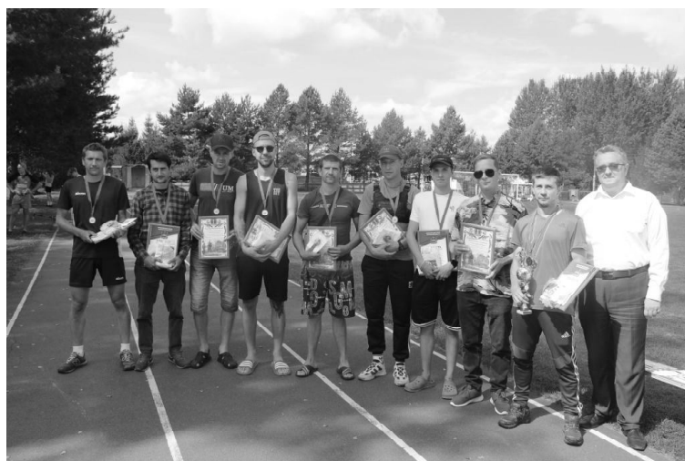
Награждение районной команды по футболу

этот день на районном стадионе поселка Бетлица. В прошлом году День физкультурника до последнего стоял под угрозой срыва и буквально за 10 минут до начала ветер разогнал тучи. Хотя в этом году стало понятно, что никакая непогода не может помешать спортивному празднику.