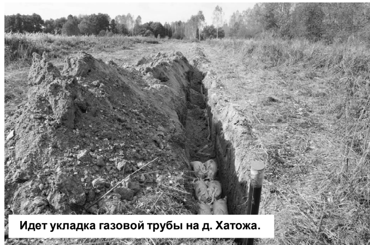
Идет укладка газовой трубы на д. Хатожа.

Параллельно газовым работам в Троицком заканчивается строительство межпоселкового газопровода в направлении Милеево - Высокое - Городец - Емельяновичи - Мамоновка,