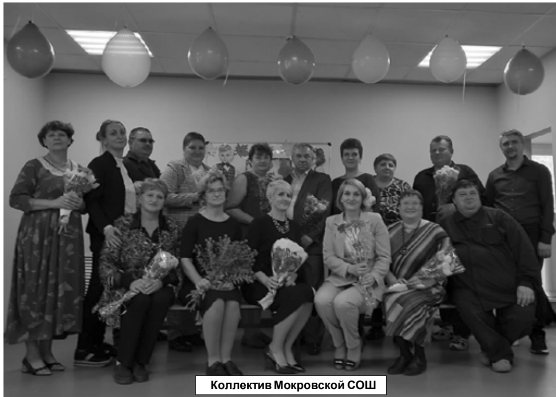
Коллектив Мокровской СОШ