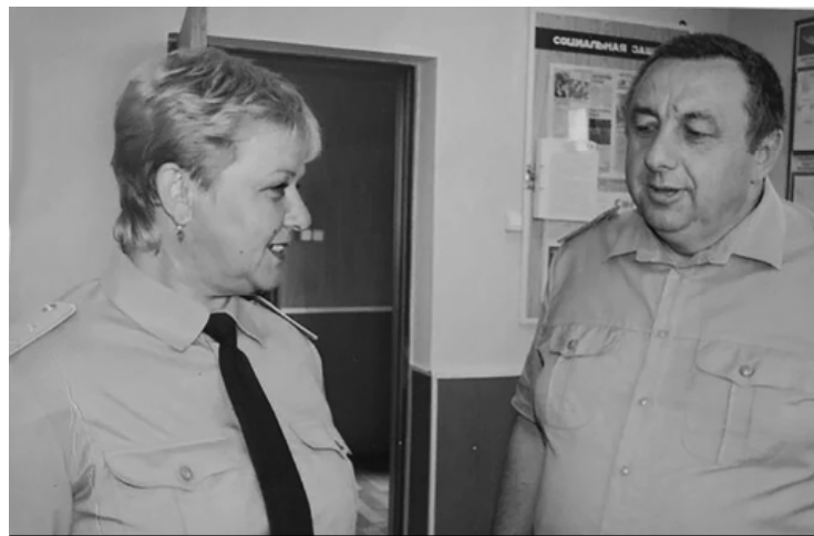
С начальником отдела кадров Смоленского отделения